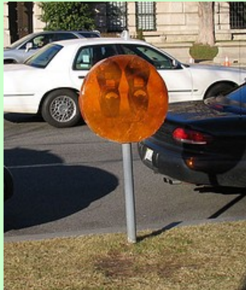
Mark Jenkins Installation "meterpops"