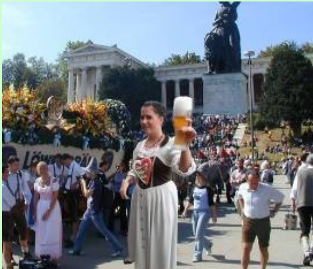
Schülerarbeit: Bildmontage einer Selbstdarstellung und eines Oktoberfestmotivs