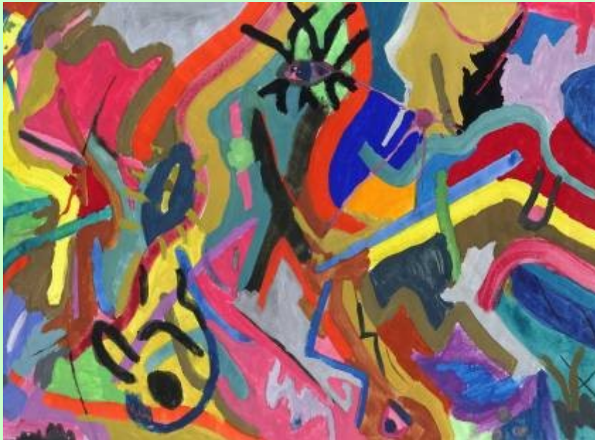
Schülerarbeit: expressive Abstraktion