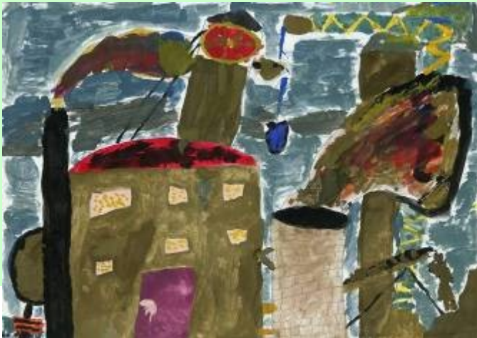
Gebäude mit Industrielandschaft in getriebenen Farben