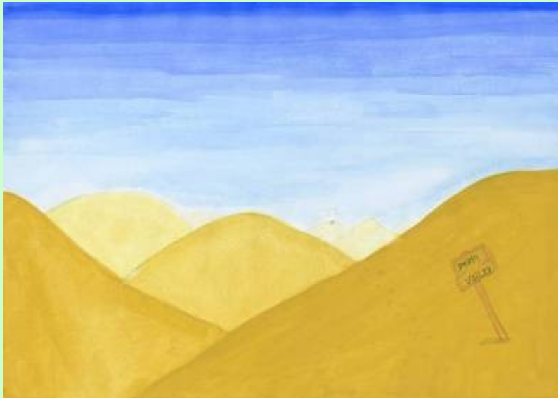
Schülerarbeit: Raumtiefe durch Aufhellung von Farben