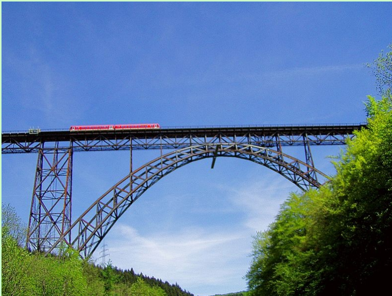
Die Münstener Brücke wurde beim Brückenfest am 04.05.2003